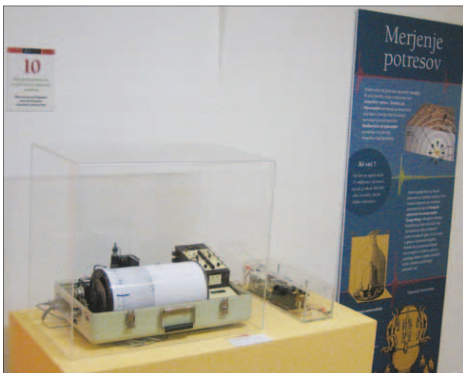
Slika 3: Na razstavi sta delovala dva seizmografa.

Prostovoljno gasilsko društvo Idrija je pripravilo reševalno vajo Potres Idrija 2011 z namenom preveriti pripravljenost in usposobljenost enot za zaščito in reševanje ter delovanje občinskega štaba Civilne zaščite. Vaja je potekala v starem mestnem jedru. Na njej je sodelovalo približno 200 reševalcev iz 22 enot – od gasilskih društev, policije, gorske reševalne službe, vodnikov reševalnih psov, Rdečega križa, Zdravstvenega doma Idrija,