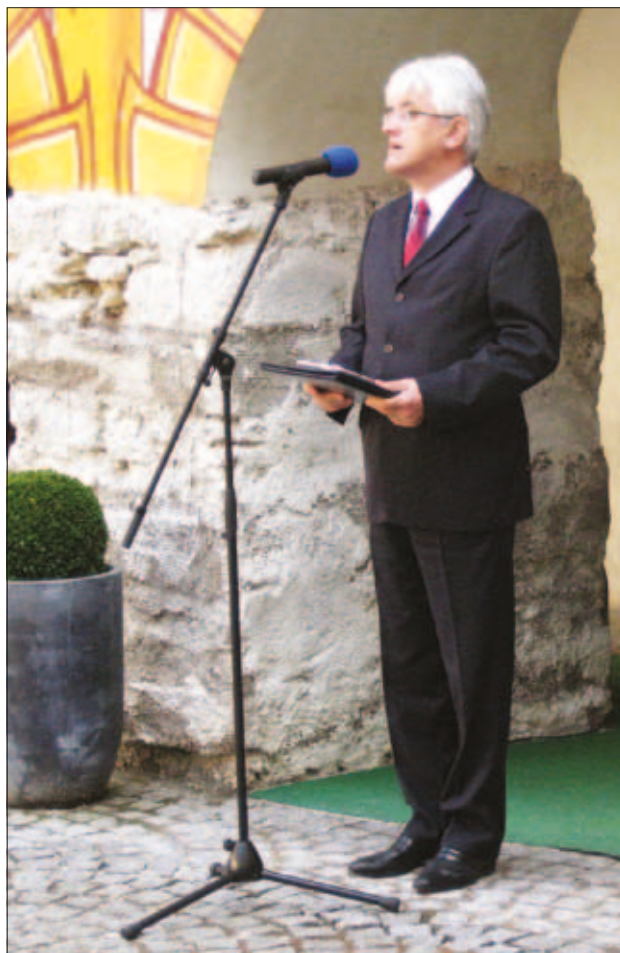
Slika 1: Razstavo Anno Domini 1511 je odprl minister za okolje in prostor dr. Roko Žarnić.

muzejem Slovenije. Razstavo je odprl minister za okolje in prostor dr. Roko Žarnić, ogledala pa si jo je tudi ministrica za obrambo dr. Ljubica Jelusič.