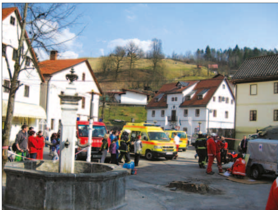
Slika 6: Utrinek z reševalne vaje Potres Idrija 2011. Figure 6: Rescue exercise Earthquake Idrija 2011.

Doma upokojencev Idrija, Psihiatrične bolnišnice Idrija, rudniških reševalcev, jamarjev in tabornikov do radioamaterjev. Ob koncu reševalne vaje je zbrane nagovorila ministrica za obrambo dr. Ljubica Jelušič.