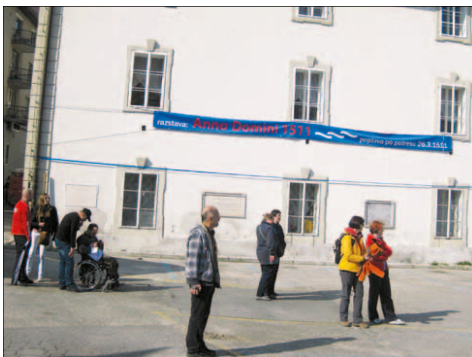
Slika 7: V Idriji je bilo z modrimi trakovi označeno, do kod bi segala gladina jezera, ki je nastalo ob potresu leta 1511 zaradi velikega plazju, ki je zajezil Idrijco. Figure 7: In Idrija, blue tape indicated water level of the lake formed after the 1511 earthquake due to a massive landslide that dammed the Idrijca River.

Tudi v sosednji Italiji so obletnico potresa obeležili s strokovnim posvetovanjem, ki je potekalo dan za našim, 27. marca 2011 v Gorici. Organizirali so ga Nacionalni inštitut za oceanografijo in eksperimentalno geofiziko, Nacionalni inštitut za geofiziko in vulkanologijo ter Civilna zaščita Furlanije - Julijske krajine. Na posvetovanju je s predavanjem sodelovala tudi sodelavka Urada za seizmologijo in geologijo Ina Cencić.