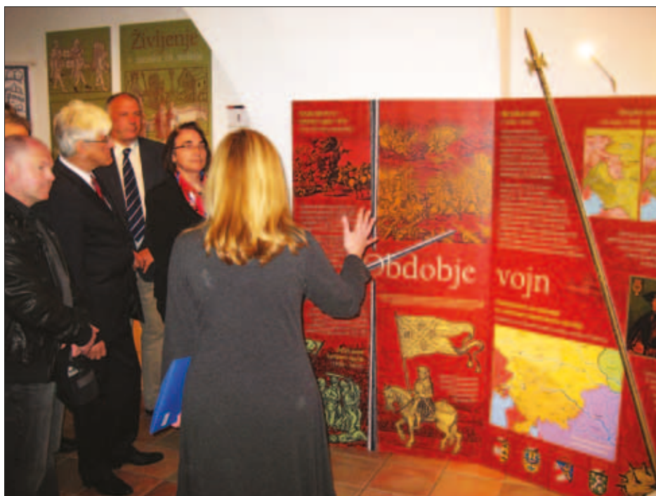
Slika 2: Razstavo sta si ogledala ministrica za obrambo dr. Ljubica Jelušič in minister za okolje in prostor dr. Roko Žarnić.