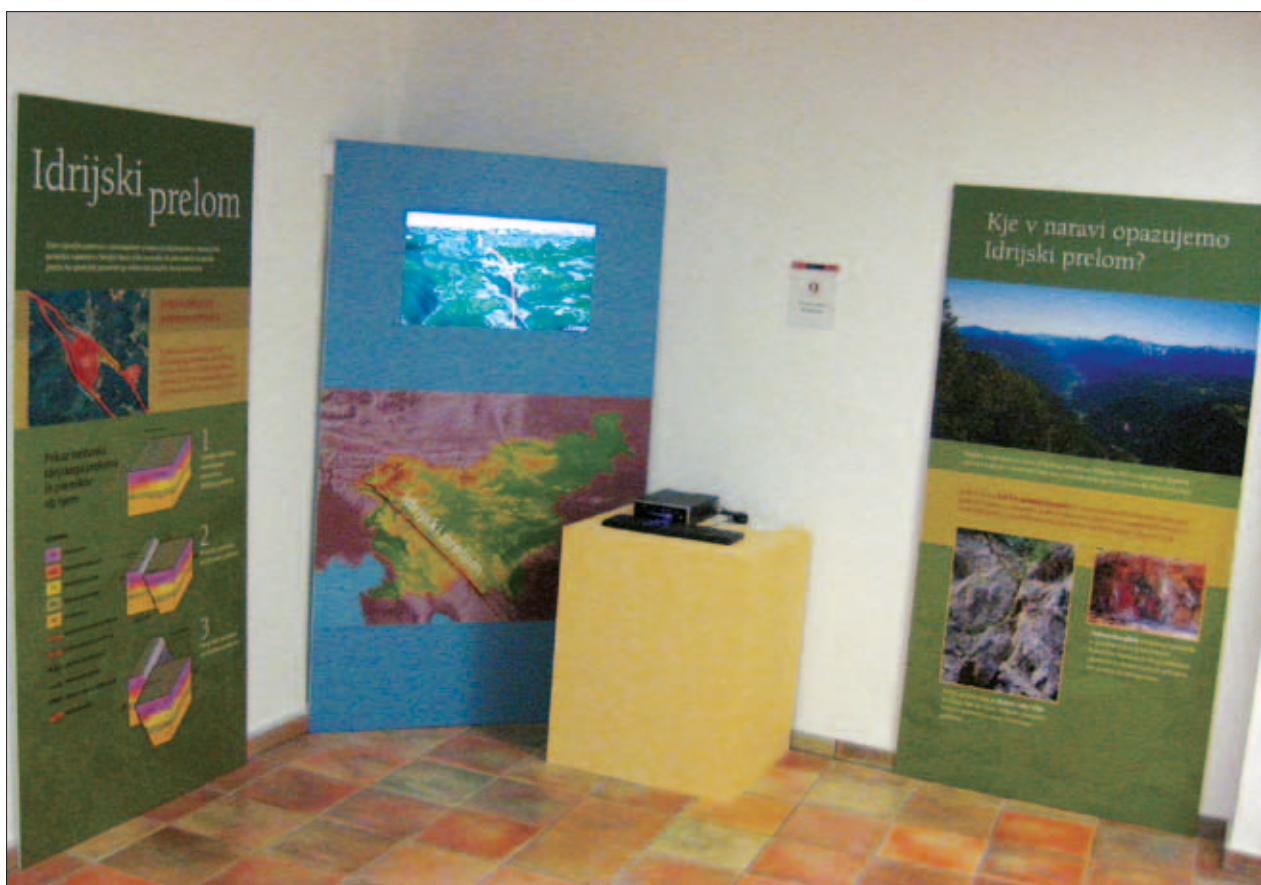
Slika 4: Nazoren prikaz Idrijskega preloma na razstavi