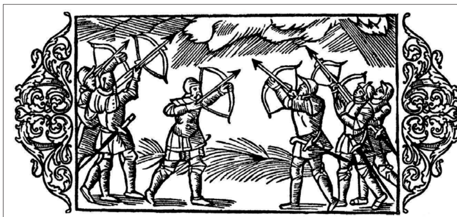
Slika 1: Srednjeveški bojevniki z nevihto in točo (Olaus Magnus, Historia de Gentibus Septentrionalibus, tretja knjiga, 1555)