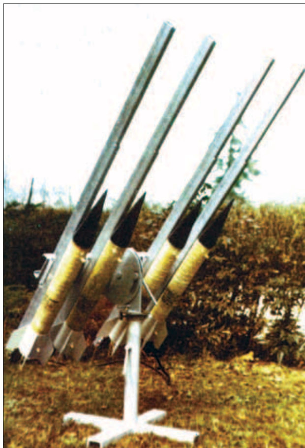
Slika 3: Primer strelnega mesta v mreži za obrambo proti toči: strelna rampa z raketami srebravega jodida

Na spletnih straneh Zavoda za razvoj Haloz ( http://www.haloz.net/prikazi.php?pid=4 ) so v opisu Obrambe vinogradov pred točo v Halozah in Slovenskih goricah na prelomu 19. in 20. stoletja zapisali: »Neučinkovitost in stroški za vzdrževanje številnih strelnih postaj ter stroški za odpravo škode, ki je nastala ob pogostih nesrečah, so presegali škodo, ki jo je povzročila toča. Če k temu prištejemo še številne ranjene in pohabljenе, je bilo jasno, da se streljanje ni izplačalo in so ga pred prvo svetovno vojno popolnoma opustili. Obdobje streljanja proti toči pa lahko označimo le kot kratko epizodo v zgodovini vinogradništva, z nekaj romantike, ki ni prinesla koristi, pač pa je zapustila vrsto invalidov, ki so se pri streljanju ponesrečili.« Podobno Wieringa in Holleman (2006) v pregledu obrambe pred točo pravita, da je edini pozitiven učinek izstreljevanja eksplozivnih raket in granat na točonosne oblake zgolj čustveno zadoščenje strelcev, da so streljali na sovražnika. V Italiji namreč tri četrtine tistih, ki še danes uporabljajo protitočne topove, trdi, da so zadovoljni z učinkom svoje dejavnosti, čeprav njena učinkovitost ni bila nikdar dokazana, temveč celo ovržena. Prav ste prebrali – še danes izdelujejo protitočne topove (glej npr. http://www.hailcannon.com/ ) ter jih žal tudi kupujejo in uporabljajo!