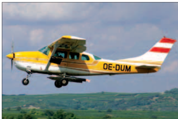
Slika 5: Letalo s plamenicami, ki se v Avstriji uporablja za obrambo pred točo