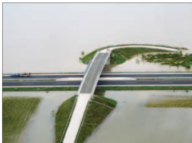
Slika 3: Avtocesta Ljubljana-Zagreb na Brežiškem polju, 19. september 2010