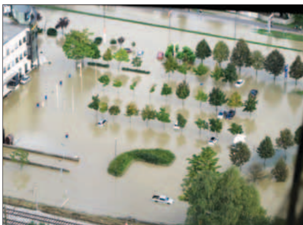
Slika 4: Poplavljeni Tržaška cesta v Ljubljani, 19. september 2010 Figure 4: Flooded road Tržaška cesta in Ljubljana, 19 September 2010

povodnji z večjimi povodnjimi v Sloveniji pa v članku Primerljivost poplave septembra 2010 z zabeleženimi zgodovinskimi poplavnimi dogodki (Mira Kobold).