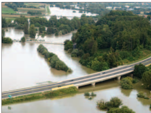
Slika 2: Sotočje Save in Krke, 19. september 2010

Lata 2010 so poplave rek in morja zahtevale najmanj tri človeška življenja, povzročile so zelo veliko materialno škodo na stanovanjskih in gospodarskih objektih, prometnicah, vodni infrastrukturi, na kmetijskih površinah in lastnini prebivalcev. V preglednici 1 so opisane reke in nekateri potoki, ki so poplavljali leta 2010, ter poplavljanje morja ob slovenski obali. Poplavljanje manjših potočkov in hudournikov v preglednici ni navedeno.