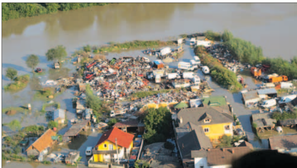
Slika 5: Poplavljeni deponija ob Ljubljanici pri Zalogu, 19. september 2010 Figure 5: Flooded waste disposal site at the Ljubljanica river near Zalog, 19 September 2011