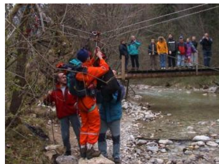
Slika 7: Transport vodnika in psa prek vode z vravno tehniko.