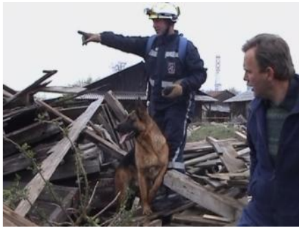
Slika 1: Na ruševini. Vodnik ukazuje psu kje naj išče.