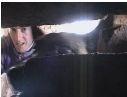
Slika 2: Tako vidi ponesrečeni v ruševini svoja rešitelja - psa in njegovega vodnika.