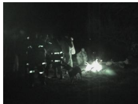
Slika 8: Včasih je potrebno delo nadaljevati tudi ponoči.