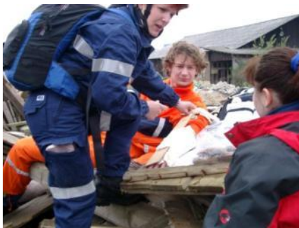
Slika 4: Nudenje prve pomoči.