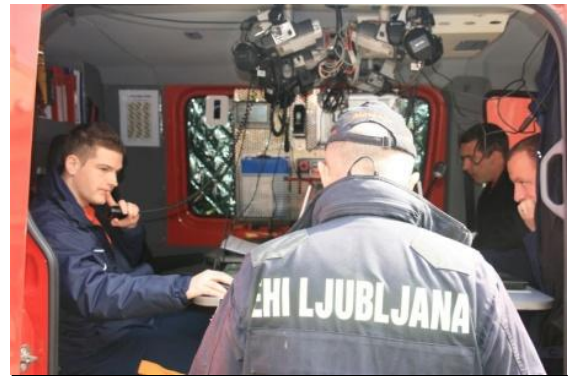
Ekipe za podpro vodenju

V vaji bo uporabo postopkov organizacije vodenja preizkušal del štaba Civilne zaščite Mestne občine Ljubljana in ekipa za podporo vodenju ter testno uporabljala računalniško podporo vodenju, osnovano na incident command system. Preizkušanje bo osnovano na organizaciji uporabe večjega števila domačih in tujih reševalnih enot na večjem številu delovišč.