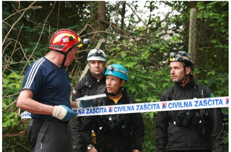
Utrinek z vaje »Ljubljana 2011«