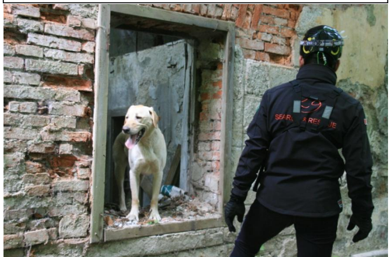
Utrinek z vaje »Ljubljana 2011«