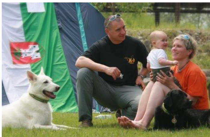
Utrinek z vaje »Ljubljana 2011«

14. mednarodno vajo vodnikov reševalnih psov »Ljubljana 2012« prireja Mestna občina Ljubljana, Oddelek za zaščito, reševanje in civilno obrambo in Društvo vodnikov reševalnih psov Slovenije (DVRPS), sodeluje pa tudi Uprava RS za zaščito in reševanje. Vaja se odvija v okviru aktivnosti državne vaje »Potres 2012«. Preverili bomo sprejem, namestitve in uporabo tuje reševalne pomoči, reševalne sposobnosti vodnikov in psov v ruševini in pri iskanju pogrešanih oseb v naravi ter posamezne elemente organizacije reševanja ob potresu: del štaba CZ MOL, ekipo za podporo vodenju, ekipo za preskrbo s hrano, ekipe za osvetljevanje, uporabo računalniške aplikacij za podporo vodenju, rešitve v osnutku priročnika za pripravo države gostiteljice za sprejem mednarodne pomoči.