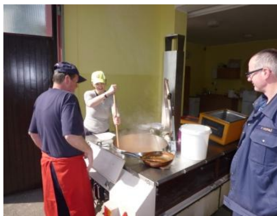
Delo ekipe za oskrbo s hrano

Vaja je zastavljena tako, da v kar največji meri posnema resnično situacijo. Osnova vaji je dejstvo potresne nevarnosti osrednjega dela Slovenije ter predpostavka o potrebi po mednarodni reševalni pomoči ob potresu. Poudarek pri izvajanju aktivnosti ekip je na najdbi pogrešanih. Ekipe bodo morale biti na razpolago za reševanje ves čas vaje in ne bodo imele vnaprej znanega urnika, vrste dela niti števila pogrešanih oseb. V skladu z mednarodno prakso bo oblikovan sprejemni center za reševalne ekipe in bazni tabor od koder bodo ekipe odhajale na reševalne akcije. Način dela je prepuščen ekipi. Ekipe bodo morale same poskrbeti za svojo nastanitev in prehrano, prav tako morajo imeti za opravljanje nalog svojo opremo. Vse navedeno je skladno z