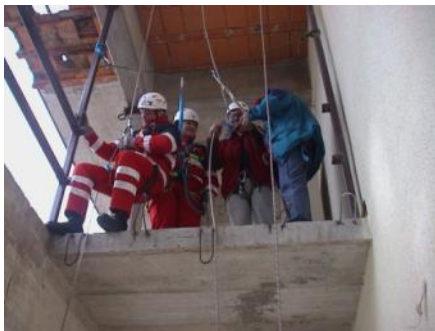
Slika 3: Da bi lahko prišli višje ali globlje v ruševini ali v naravi je treba znati premagati višino.