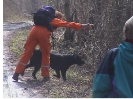
Slika 5: Iskanje pogrešanih v naravi. Išči!