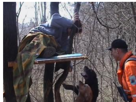
Slika 6: Iskanje pogrešanih v naravi. Veselje najdenega, psov in vodnika.