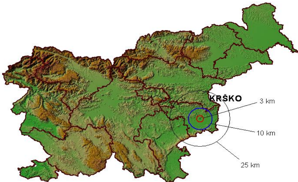
Slika 1: Območja načrtovanja zaščitnih ukrepov ob jedrski nesreči v NEK

Občine in regija so v tej oceni razvrščene v tri od petih možnih razredov ogroženosti ob jedrski nesreči v NEK.